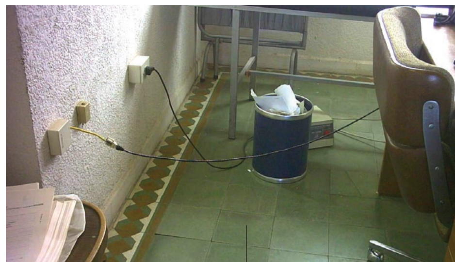
En los puestos de trabajo se perciben a menudo distintas condiciones de inseguridad.

En cada oportunidad, manifestamos que cada uno de nosotros convive con distintos riesgos según el puesto de trabajo, pero no solo en el área laboral, si no en cualquier parte y donde nos encontremos, puede ser la calle, la plaza, el campo, la ruta, nuestra casa, un cine, un restaurante, un boliche, etc. En todas partes estamos expuestos a riesgos, por lo tanto los asistentes, a partir de los conocimientos que incorporen, podrán acotar y encapsular el riesgo, para minimizar la probabilidad de que éste